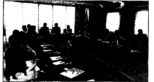
İpekyolu Kalkınma Ajansı, Haziran 2015, Gaziantep